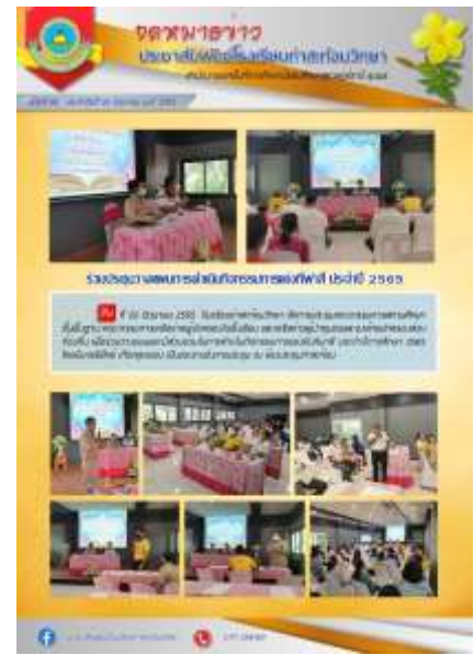
ประชุมคณะกรรมการสถานศึกษา ภาคเรียนที่ ๑ ประจำปีการศึกษา๒๕๖๕ ณ โรงเรียนท่าสะท้อนวิทยา วันที่ ๒๓ พฤษภาคม ๒๕๖๕