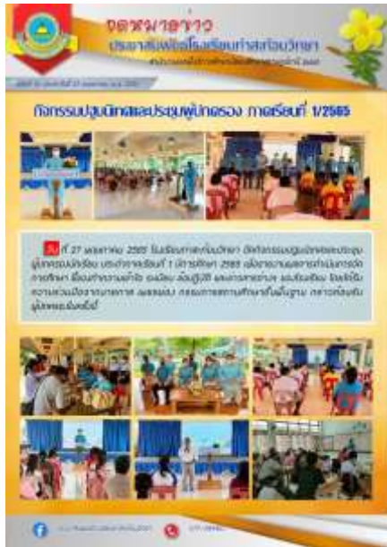
การประชุมผู้ปกครองนักเรียนภาคเรียนที่ ๑ ประจำปีการศึกษา ๒๕๖๕ ณ โรงเรียนท่าสะท้อนวิทยา วันที่ ๒๗ พฤษภาคม ๒๕๖๕