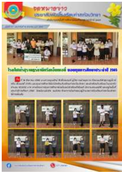
โรงไฟฟ้าสุราษฎร์ธานีกรีนเอ็นเนอयी มอบทุนการศึกษานักเรียนประจำปีการศึกษา ๒๕๖๕ ณ โรงเรียนท่าสะท้อนวิทยา วันที่ ๑๘ สิงหาคม ๒๕๖๕