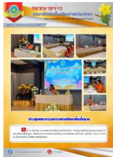
ประชุมคณะกรรมการสถานศึกษา ภาคเรียนที่ ๒ ประจำปีการศึกษา๒๕๖๕ ณ โรงเรียนท่าสะท้อนวิทยา วันที่ ๘ กันยายน ๒๕๖๕