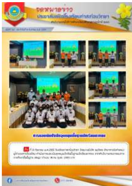
มอบเงินอุดหนุนปัจจัยพื้นฐานนักเรียนยากจน ประจำปีการศึกษา ๑/๒๕๖๕ ณ โรงเรียนท่าสะท้อนวิทยา วันที่ ๘ กันยายน ๒๕๖๕