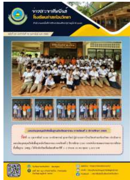
มอบเงินอุดหนุนปัจจัยพื้นฐานนักเรียนยากจน ประจำปีการศึกษา ๒/๒๕๖๕ ณ โรงเรียนท่าสะท้อนวิทยา วันที่ ๑๖ กุมภาพันธ์ ๒๕๖๖