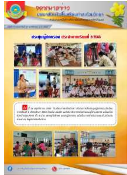
การประชุมผู้ปกครองนักเรียนภาคเรียนที่ ๒ ประจำปีการศึกษา ๒๕๖๕ ณ โรงเรียนท่าสะท้อนวิทยา วันที่ ๒๔ พฤศจิกายน ๒๕๖๕