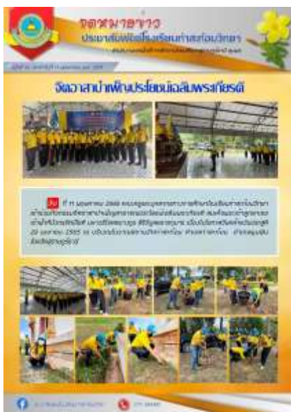
คณะครูและบุคลากรทางการศึกษาโรงเรียน ท่าสะท้อนวิทยา เข้าร่วมกิจกรรมจิตอาสา ณ วัดท่าสะท้อน วันที่ ๑๑ พฤษภาคม ๒๕๖๕