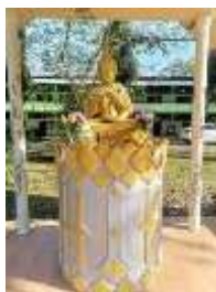
“พระพุทธรูปปางปฐมเทศนา”