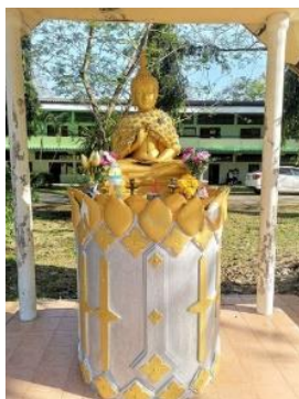
“พระพุทธรูปปางปฐมเทศนา”